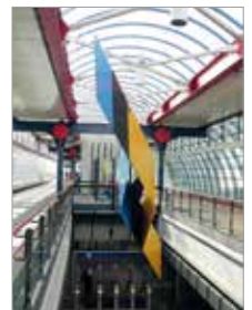
Foto voorblad: Amsterdam Sloterdijk Sculptuur Charles Marks (Bron Spoorbeeld)